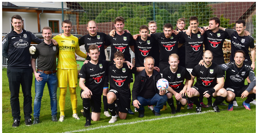
Letztes Heimspiel Frühjahr 2024 mit Ball spende!

Der Herbstdurchgang der Saison 2024/25 lässt sich in einem Wort zusammenfassen: Herbstmeister . Nach 13 von 26 Runden stehen wir mit zehn Siegen, zwei Unentschieden und nur einer Niederlage bei 32 Punkten. Auf Platz zwei folgt St. Jakob mit 29 Punkten, und der Pöllauer Sportklub mit 25 Punkten. Das sportliche und emotionale Highlight im Herbst war die Partie gegen den Pöllauer Sportklub. Mit einem 2:1-Sieg gegen die jungen Pöllauer, die zu diesem Zeitpunkt noch Zweiter waren, konnten wir vor einer wunderbaren Kulisse in Miesenbach bereits frühzeitig den Herbstmeistertitel feiern. Das heißt aber auch, dass uns im Frühjahr eine für uns ungewohnte Situation erwartet: Zum ersten Mal wird der UFC Miesenbach als „Gejagter“ in die zweite Meisterschaftshälfte starten.